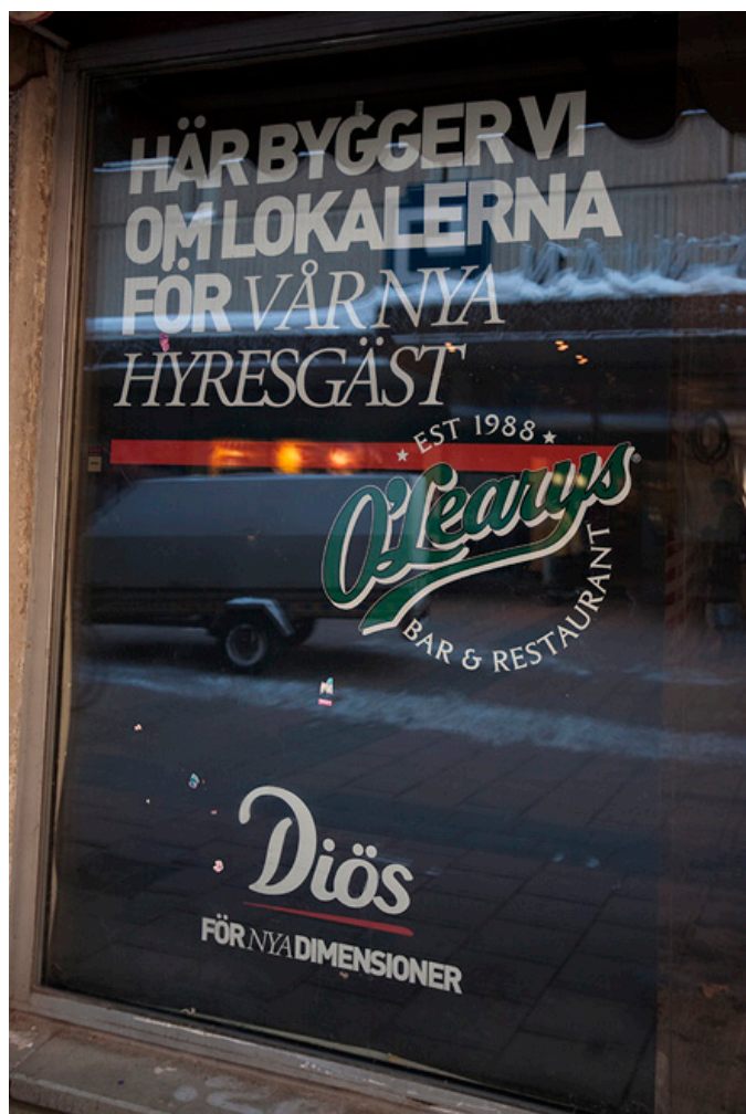
Norr 29:5, Gävle

• Diös har per den 1 februari 2010, sålt industri-/lagerfastigheten, Hammaren 8, Borlänge. Köpeskillingen uppgick till 16 Mkr.