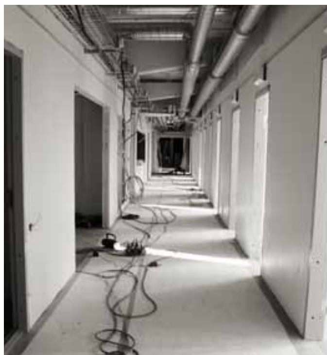
Förädlingsprojekt, Nejonögat 3, Östersund

• Diös Fastigheter har i två olika transaktioner under juli månad sålt fastigheterna Mossarotträsk 1:326 i Skellefteå och Svanen 17 i Ludvika med en total uthyrningsbar yta om ca 3 576 m 2 . Försäljningspriset uppgick till 10,5 Mkr, vilket överensstämde med senaste värdering. Tillträdesdag var den 1 juli 2009.