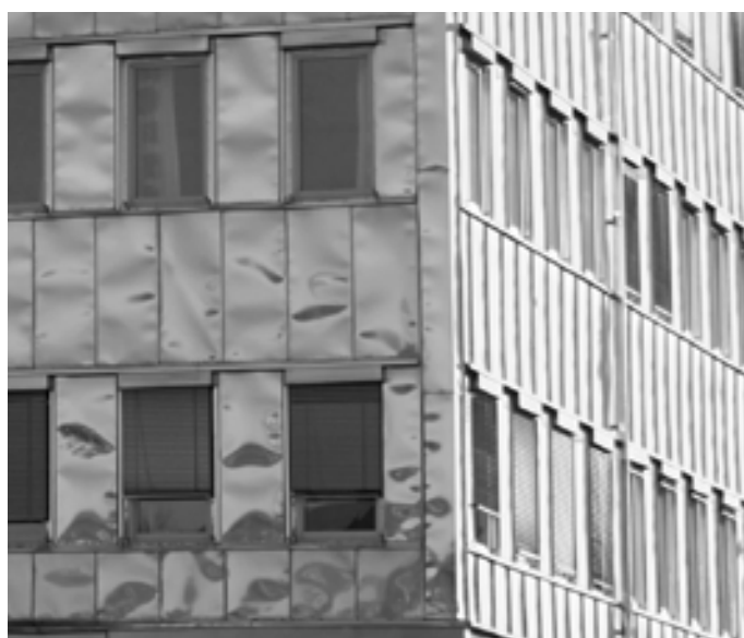
Aurorum 2, Luleå