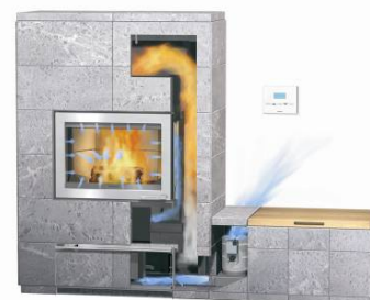
Tulikivi Green C10-uuninohjausjärjestelmä