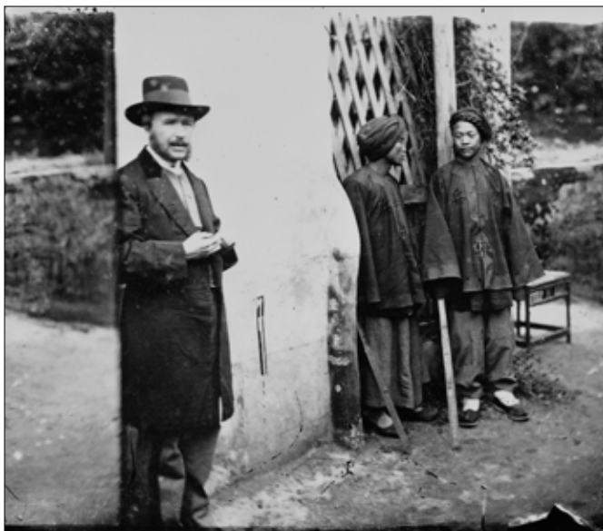
Thomson och två manchuiska soldater, Xiamen, Fujian, 1871 Thomson uppträdde sällan i sina egna fotografier. Här syns han emellertid tillsammans med två manchuiska soldater i staden Amoy, vid Qingimperiets södra gräns.