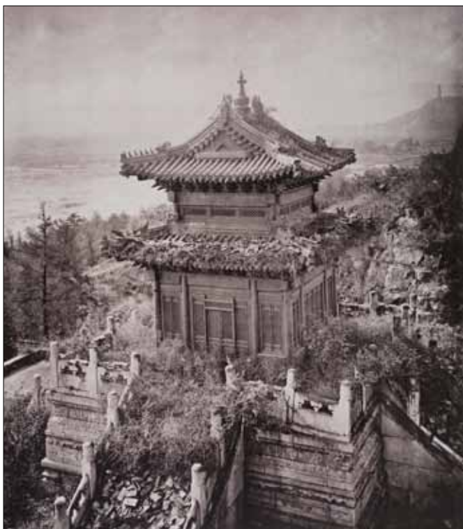
Ruinerna av Bronstemplet i Trädgården med tydliga krusningar, Beijing, 1871-72

Bronstemplet var en av de mest imponerande byggnaderna i Sommarpalatset och uppfördes 1755. Det var enligt Thomson "ett fint exempel på kinesisk tempelarkitektur som visade det ytterst omsorgsfullt utförda detaljarbetet, och den stora kinesiska skickligheten i att arbeta i metall och avpassa den till nästan alla bruk". Även om många av dessa föremål fördes bort av fransmännen och briterna 1860 klarade sig byggnaden någorlunda intakt.