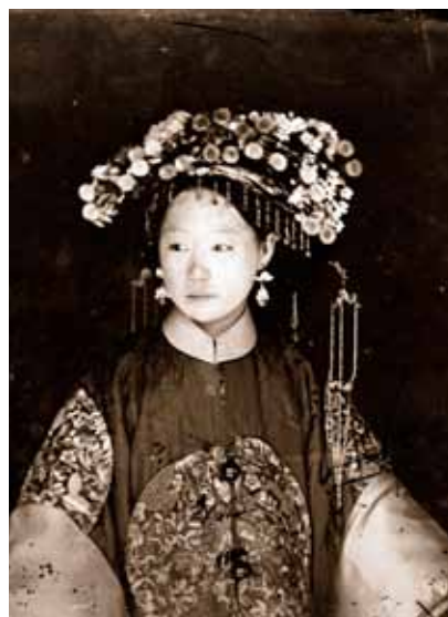
En manchuisk brud, Beijing, 1871-72.

KINA. Fotografierna i Östasiatiska museets utställning är hämtade från Thomsons resor till bla Guangdong, Fujian, Beijing, Kinas nordöstra delar och ned för den stora Yangzifloden (1868-1872). Till skillnad från de porträttbilder han försörjde sig på - portätt av rika och berömda personer - visar Thomsons reseskildringar den mänskliga aspekten av livet i Kina genom sin omfattande dokumentation av vardagliga gatuscener - sällan fångad av andra fotografer från den tiden. Thomson använde våtplåsteknik i sitt fotografiska arbete, det krävdes en tung och känslig utrustning med glasplåtar och kemikalier och Thomson anlätade som mest tio bärare för att frakta utrustningen.