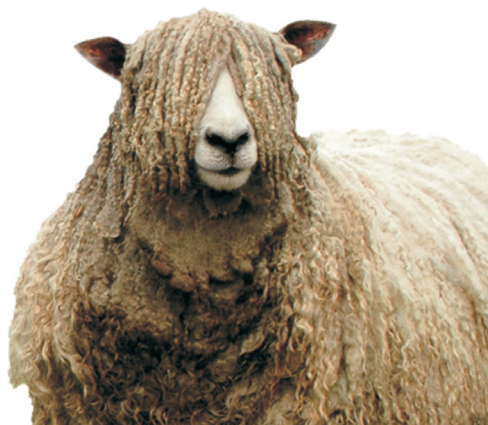
Sju. Så många olika sorters får bidrar till Westbond.