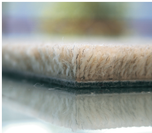
Miljövänligt. 74 % återvunnet material i plattan, kompletterat med naturlig förnyelsebar ull.