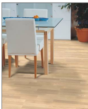
Saarni Nature White Matt

Polarwood-parketit on helppo asentaa liimattomilla RealLoc-taittoponteilla, joiden tarkan mitoituksen ansiosta lattian saumoista tulee lähes näkymättömät. Polarwood-parketit soveltuvat käytettäväksi myös lattialämmityksen kanssa.