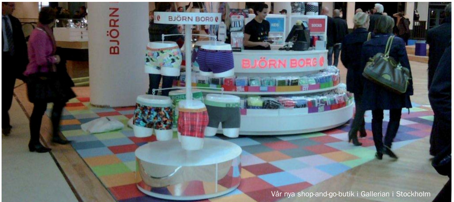
Vår nya shop-and-go-butik i Gallerian i Stockholm