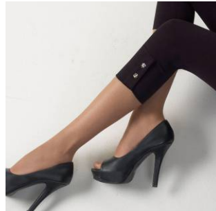
Norlyn Safari Style capri (41165)