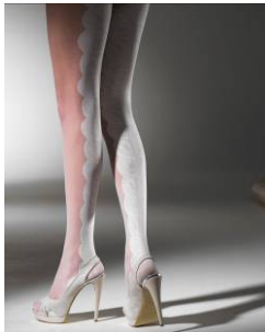
Vogue Precious (95264)