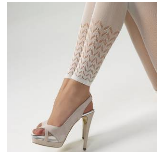
Norlyn Serenity leggings (41171)