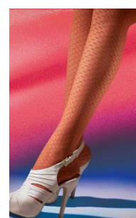
Vogue Colore Cubic (95283)