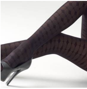
Norlyn Moder Clover (41173)