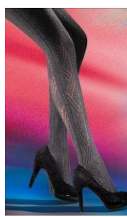
Vogue Colore Braided Lines (95286)