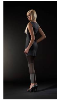
Vogue Colour Reaction leggings (95271)