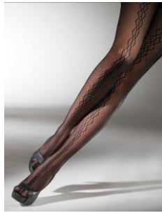
Vogue Net Eclipse (95267)