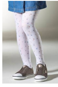
Vogue Young Lady Flower Meadow (95294)