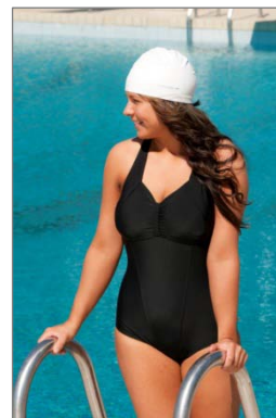
Plus-uimapuku 60744, n. 40,00 €