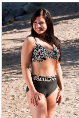
Villiviini Plus -bikini 62966, n. 39,00 €