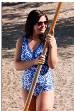
Villiviini Plus -uimapuku 62999, n. 41,50 €